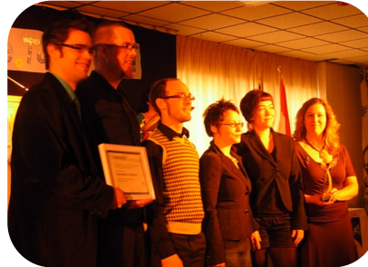
Au Concours québécois entrepreneuriat le groupe d'entrepreneur de la brasserie artisanale Le Cabestan à Matane.

Visitez notre site internet : www.reseauaccescredit.com